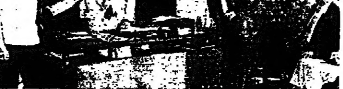
الحافظ بسيف المهنسين الوزير في الشمال